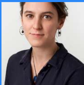
Presidenta Loraine Schlötterbeck